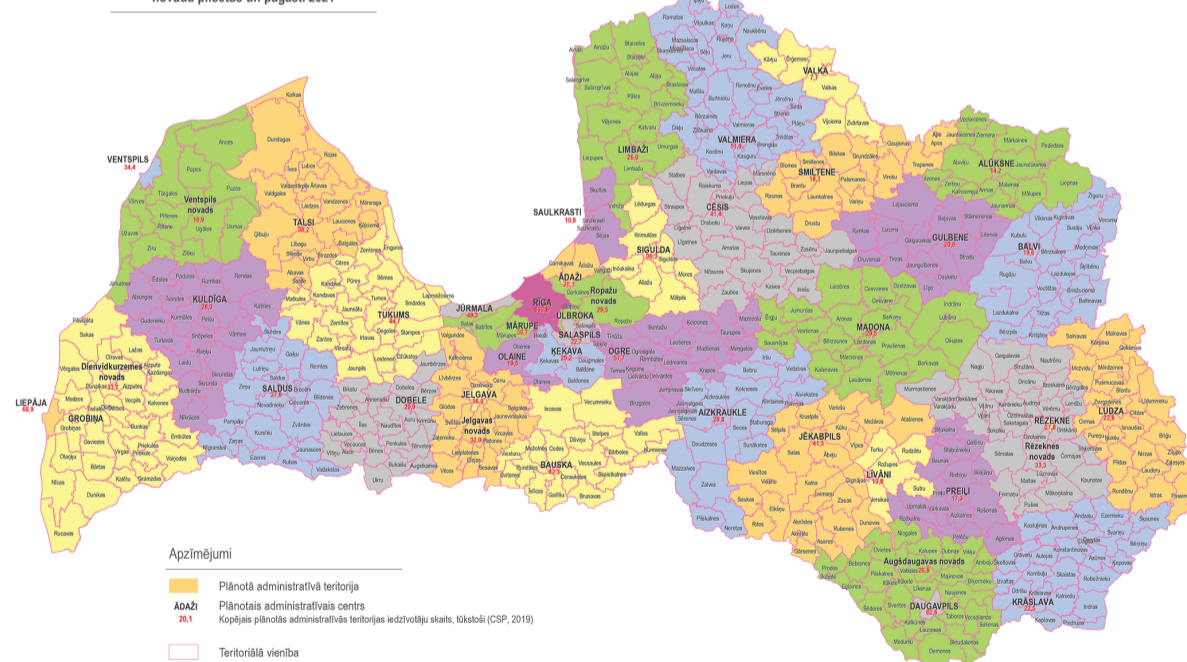
Administratīvi teritoriālais iedalījums un tā teritoriālās vienības – novada pilsētas un pagasti 2021

das novada dome 30. decembra sēdē nolēma, sadarbojoties ar Kuldīgas un Alsungas novada pašvaldībām, uzsākt jaunizveidojamā Kuldīgas novada pašvaldības Attīstības programmas 2022. – 2028. gadam un Kuldīgas novada ilgtspējīgas attīstības stratēģijas 2022. – 2046. gadam izstrādi.