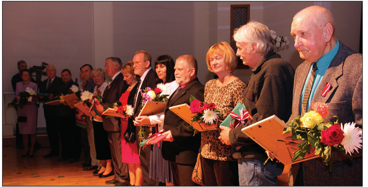
Tika godināti arī sakoptāko sētu saimnieki.