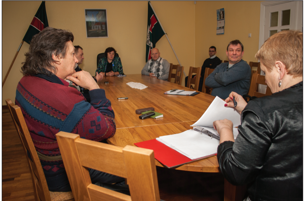
Skrundas novada Attīstības komiteja kārtējā sēdē apspriež novada attīstības virzību.

Šajā gadā turpināsies vairāki projekti, piemēram, Latvijas – Lietuvas projekta „Mana sociālā atbildība” laikā šogad tiks iegādātas funkcionālās gultas un pacientu skapīši, projekta „Ģimenes