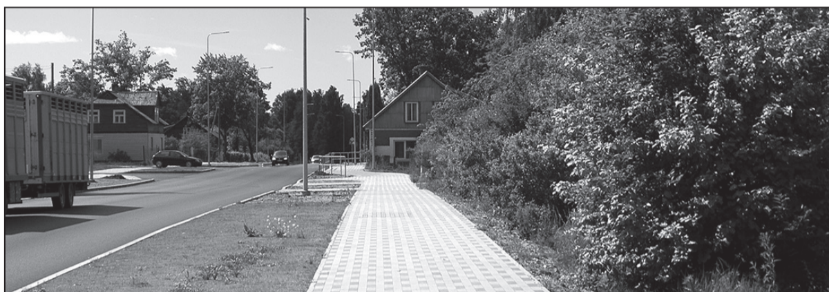
Tranzītiela pirms rekonstrukcijas un pēc darbu pabeigšanas.

uz iepirkuma procedūras rezultātiem, veica ģenerāluzņēmējs SIA “Saldus ceļinieks” un apakšuzņēmēji SIA “Grobiņas SPMK”, SIA “OMS”, bruģa ieklāšanu veica SIA “A-Land” darbinieki. Būvuzraudzību veica SIA “Firma L4” sertificētie speciālisti. Projekta ieviešanas uzraudzības iestāde- LR Satiksmes ministrija.