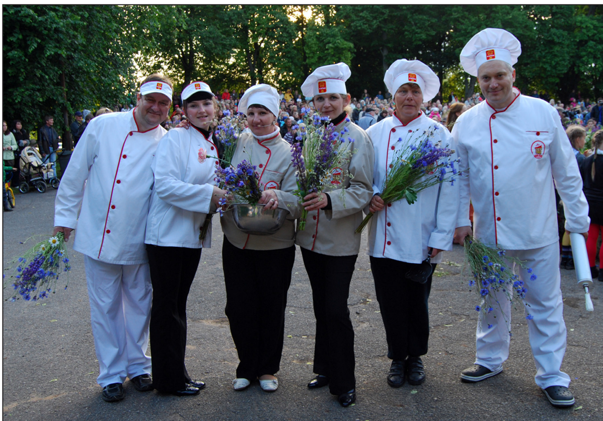
SIA "Matss" darbinieki pēc uzstāšanās Līgo svētku koncertā Skrundas pilskalnā pagājušā gada 23.jūnijā.

Aicinām iestāžu un uzņēmumu kolektīvus, domubiedru grupas, draugus un kaimiņus piedalīties Līgo vakara koncertā Skrundas estrādē. Izvēlieties dziesmu, deju vai kādu citu muzikālu priekšnesumu, lai iepriecinātu sevi un pārējos līgotājus.