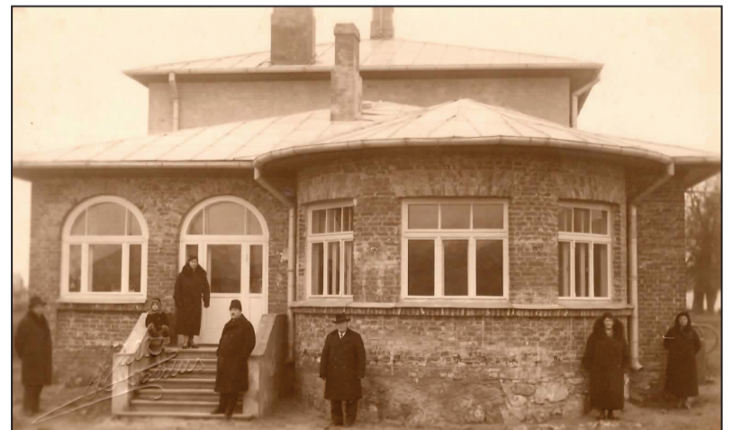
Salmu ģimene pie savas mājas (20.gs. 30. - tie gadi). Piektais no kreisās - mājas saimnieks Ernests Salms stāv vietā, kurā 2014.gada nogalē atrasts bareljefs.