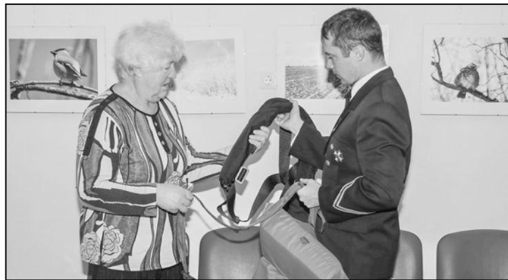
Iepazīst glābšanas aprīkojumu.

Teksts- Ieva Benefelde