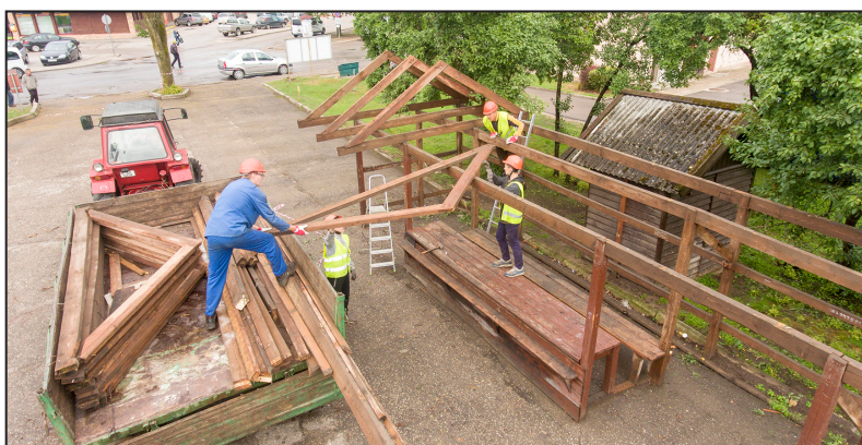
Skrundas tirgū notiek veco paviljonu demontāža.

Skrundas autoostas, tirgus laukuma un veikala "Elvi" teritorija ir viena no iedzīvotāju un viesu visapmeklētākajām vietām Skrundā. Tā kā Skrundas novada pašvaldības mērķis ir to labiekārtot, tad jau 2015. gadā tā uzrunāja Latvijas Lauksaimniecības universitātes studentus, aicinot viņus izstrādāt Stūra, Ventas un Liepājas ielu kvartāla attīstības koncepciju. Tika saņemti 15 studentu priekšlikumi. Savukārt 2016. gada 19. janvārī Skrundas kultūras namā pulcējās novada uzņēmēji, lai uzzinātu par Skrundas novada pašvaldības, Kuldī-