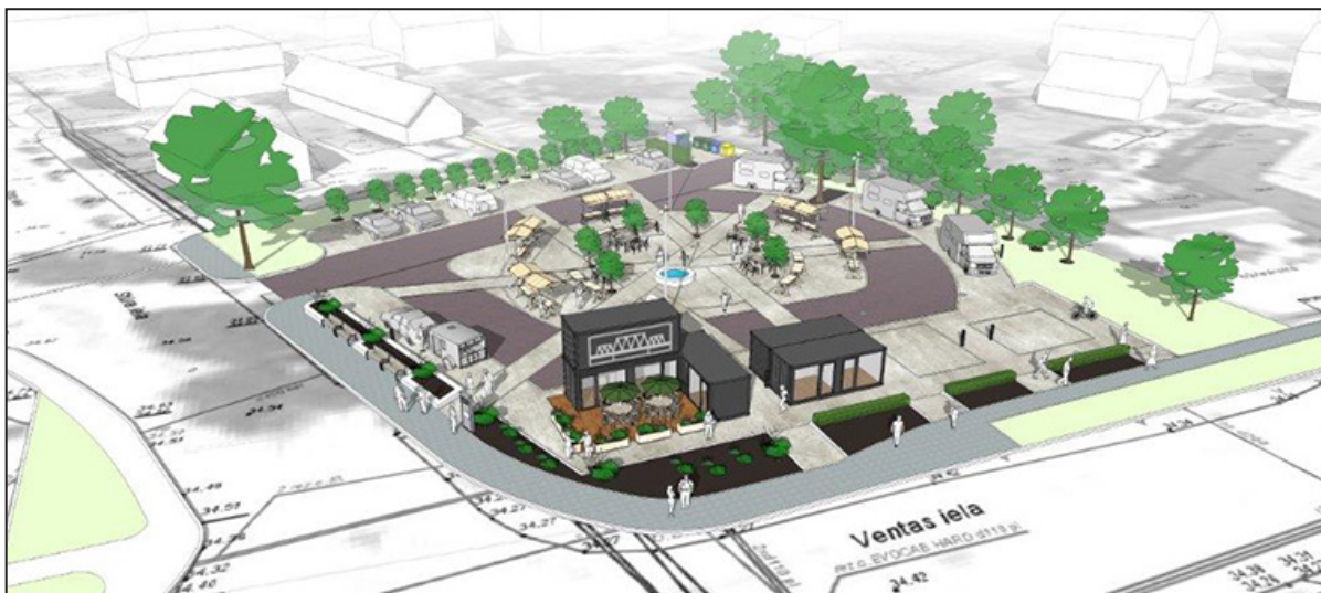
Topošā tirgus laukuma vizualizācija.