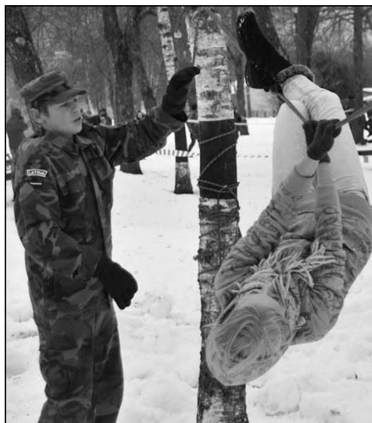
Skolēniem bija jāpārvar dažādi šķēršļi, piemēram, līšana pa virvi.