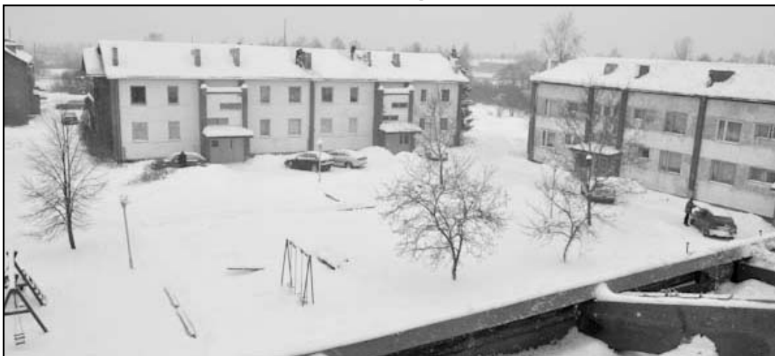
Šogad sniegs īpaši bīstams bija jumtiem.