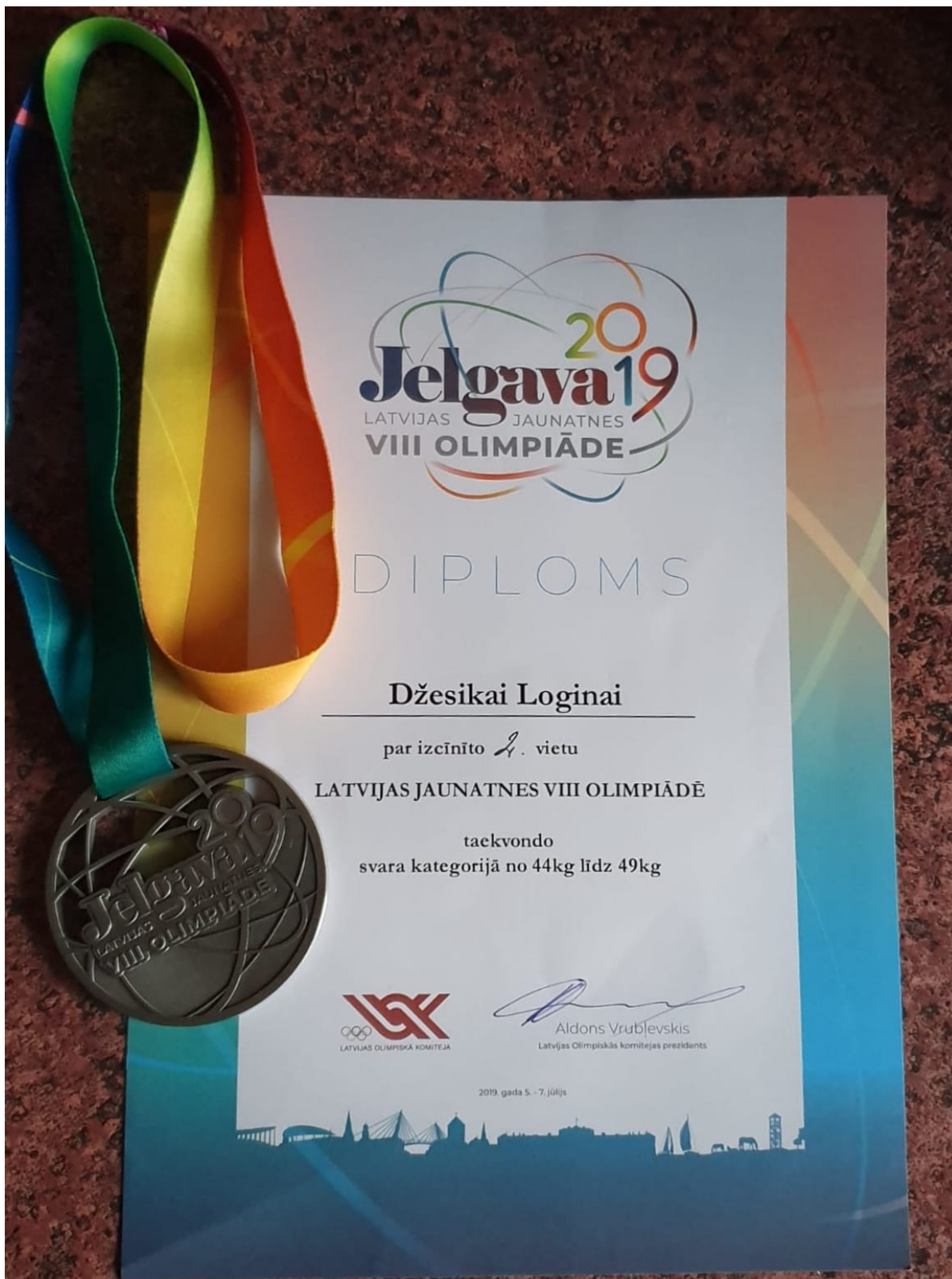
Teksts : Aivita Staņeviča